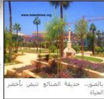
بالصور.. حديقة الصنائع تنبض بأخضر الحياة

يذكر أنه سيتم افتتاح الحديقة رسمياً في ال 31 من الشهر الحالي "أيار" حيث سيقام حفل الافتتاح بحضور عدد من الوزراء والمسؤولين وشخصيات من جمعيات تُعنى بالحفاظ على البيئة.