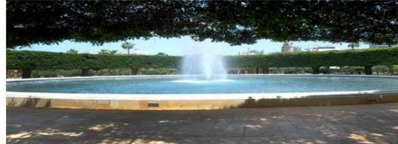
The Sanayeh Park's new flowing fountain

May 22, 2014 12:21 AM By Meris Lutz The Daily Star