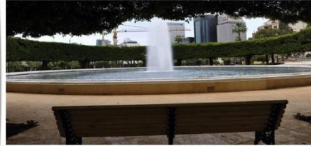
تؤسس حديقة الصنائع الجديدة نافورة عكسا كانت سابقاً (مبمس سلمان) تاريخ النشر