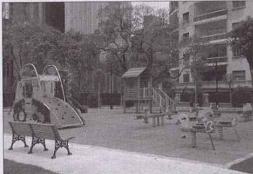
The new and improved kids area.