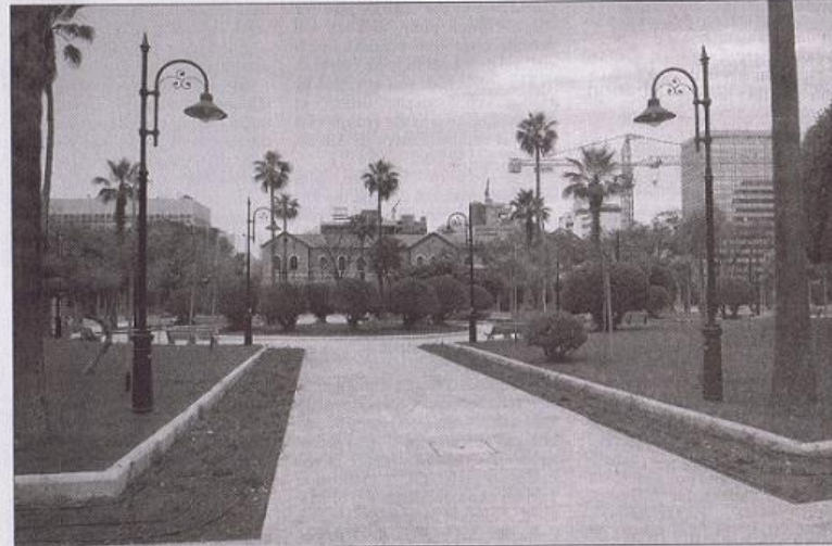
The renovations of the Sanayeh park, which began last year, cost a total of $2.5 million.

The park will remain open for approximately 12 hours a day, closing in the evenings, Moukarzel said. The rules for the park include bans on water pipes, barbecuing and damag-